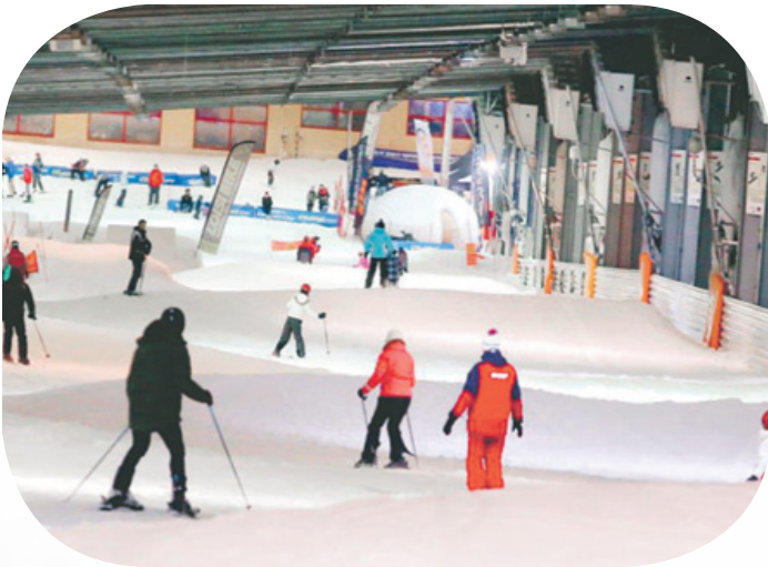
Ski, snowboard ... libre ou avec moniteurs (ESF, FFS, etc.)