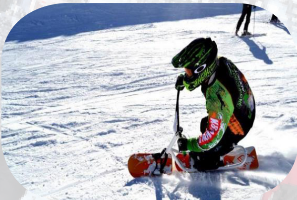
Snowscoot en pratique libre (attestation à obtenir)