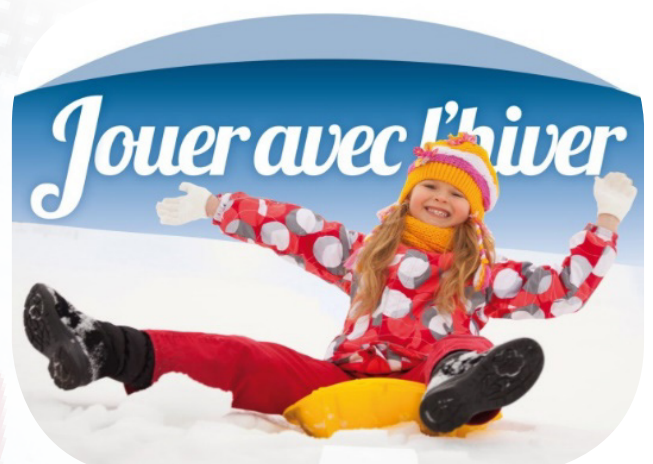
Luge pour les plus petits, jusqu'à 10 ans