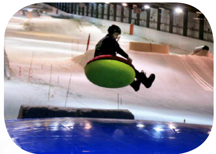
Air Bag pour le ski, snowboard, snowscoot et tubing (bouée)